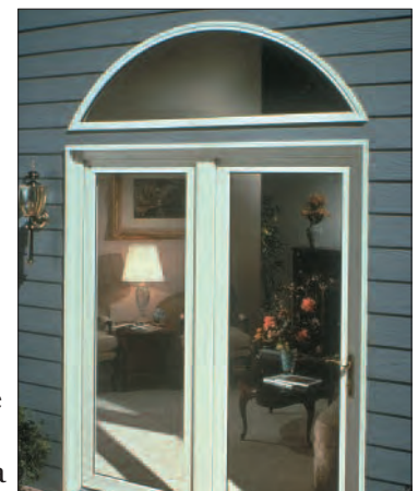
Vidrio de seguridad se requiere cerca de puertas, pasillos y Escaleras