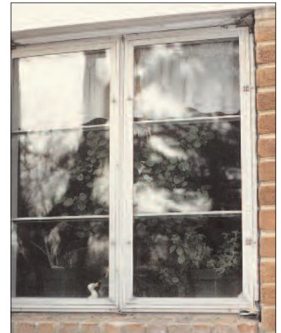
Sustitución de ventanas puede dejar claro Aberturas Permisos requieren más pequeños

Es importante buscar los requisitos en la ubicación donde se encuentra el cliente de la ventana. Usted debe estar familiarizado con el código vigente local, que afecta a las ventanas y puertas para asesorar adecuadamente a su cliente como para el producto adecuado para cada aplicación.